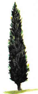
LUNG Chiparos italian