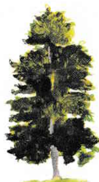
ÎNGUST Mesteacăn argintiu